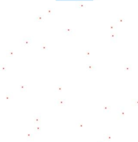
1 : Points

Nous pouvons voir ci-dessous son évolution, depuis sa création jusqu'au résultat final.