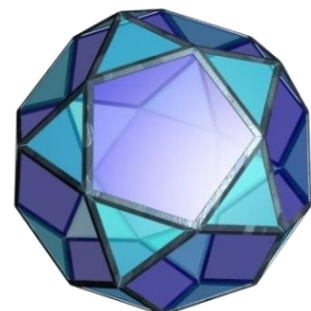
4 : Style